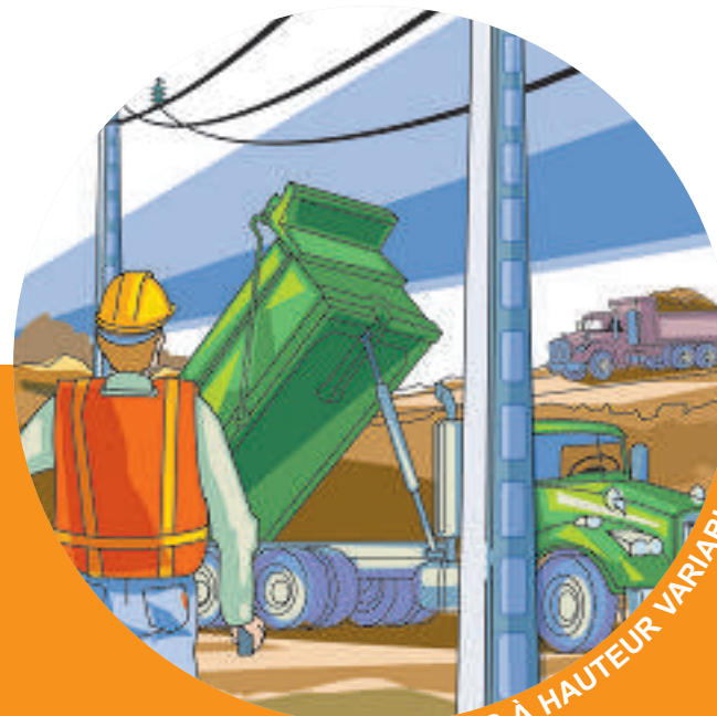
ENGINS À HAUTEUR VARIABLE