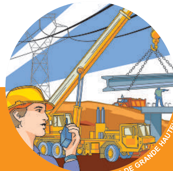
ENGINS DE GRANDE HAUTEUR