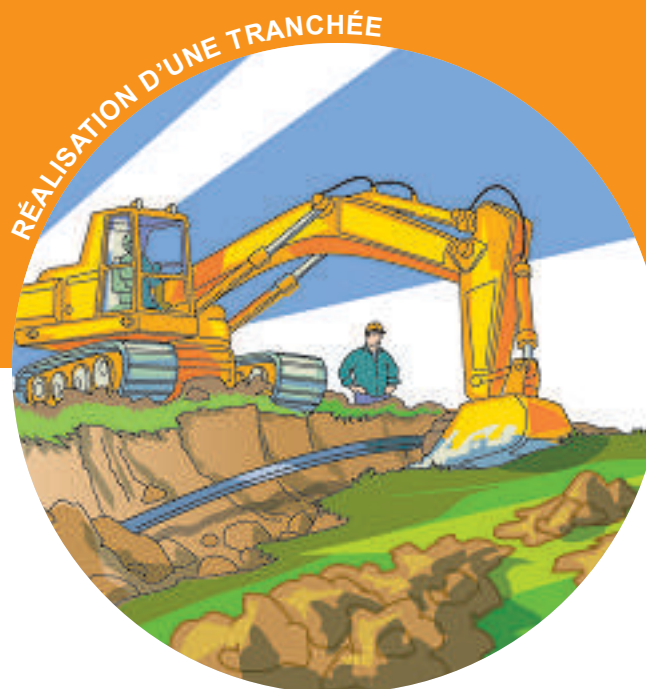
RÉALISATION D'UNE TRANCHEE