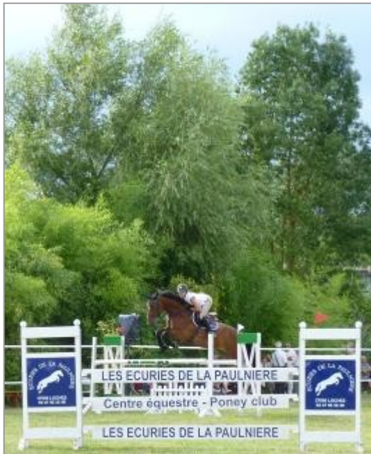
14 et 15 août : Concours de saut d'obstacles aux Viantaises.