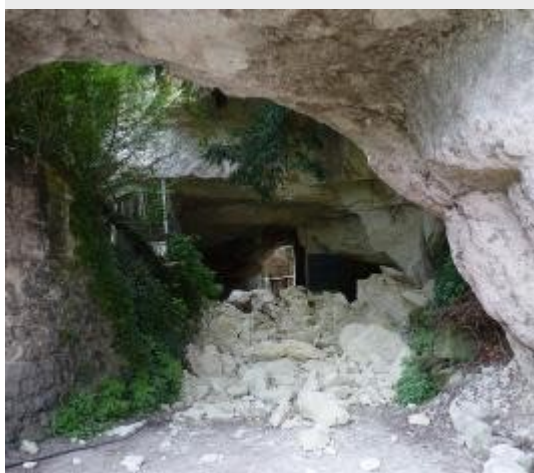
21 juillet : Effondrement de coteau rue des Grandes Caves. Un arrêté municipal d'interdiction d'accès a été pris.

La plus grande prudence est conseillée dans les caves et cavités. Le géologue du syndicat "Cavités 37", auquel adhère la commune, peut effectuer sur demande, et à un coût réduit, une visite diagnostic des caves des particuliers. Renseignez-vous en mairie.