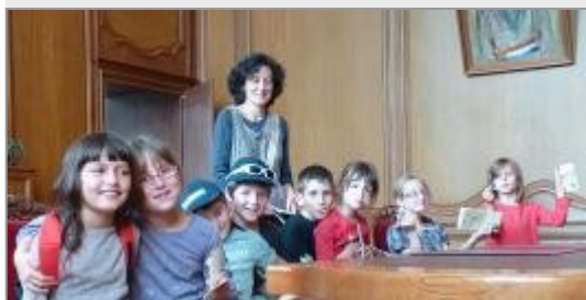
Juillet et août : "à la recherche du trésor de Foulques", jeu de piste pour les 6/12 ans.