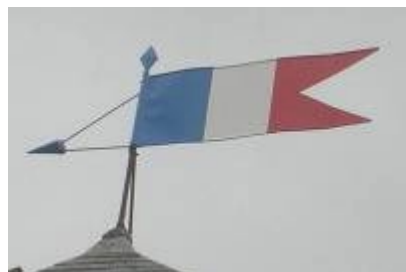
Repeinte par les agents communaux, et grâce aux Pompiers et à l'aide de leur grande échelle, la girouette flotte de nouveau, tout en couleurs, sur la mairie.