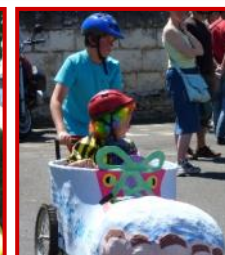
Solstice 2011, les crêpes et la course de caisses à savon, parmi toutes les animations proposées.