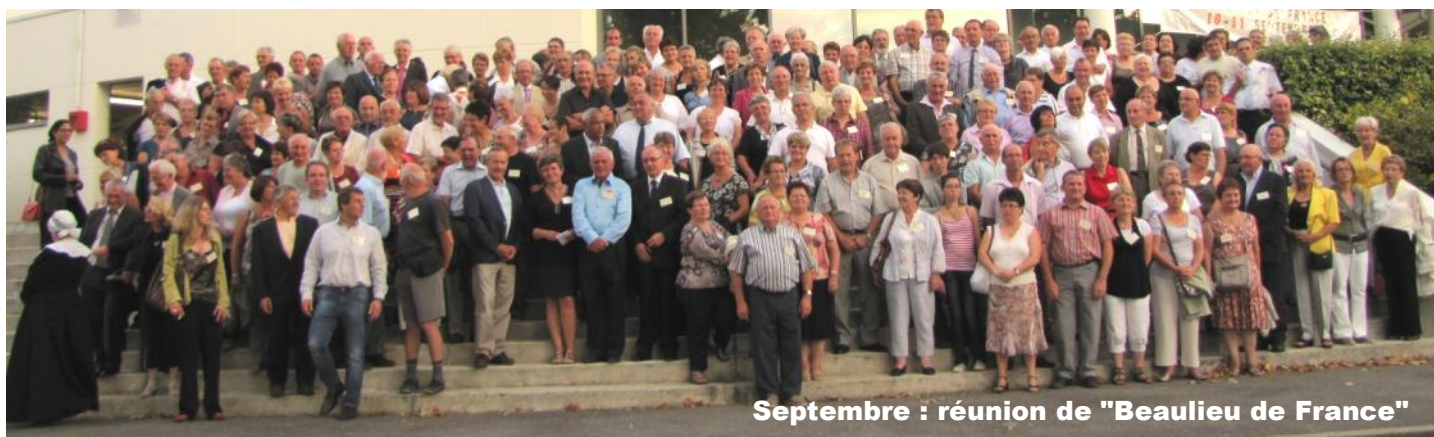
Septembre : réunion de "Beaulieu de France"

Les verts , la détermination de la municipalité pour la préservation du milieu naturel et sa politique ferme de développement durable.