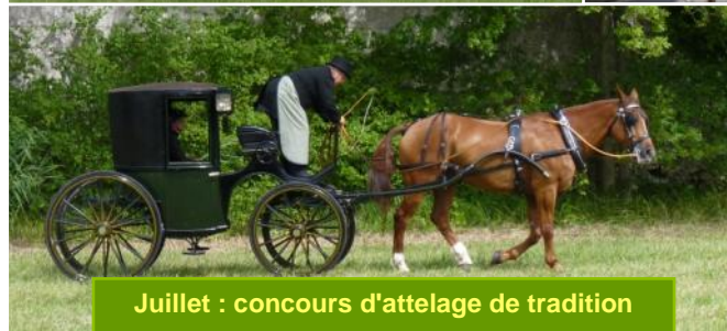
Juillet : concours d'attelage de tradition