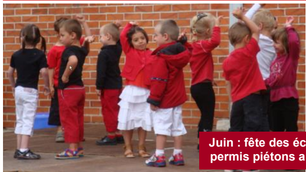
Juin : fête des écoles et remise du permis piétons aux élèves de CE2