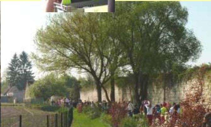
9 avril Carnaval des Ecoles (merci aux parents qui l'ont organisé)