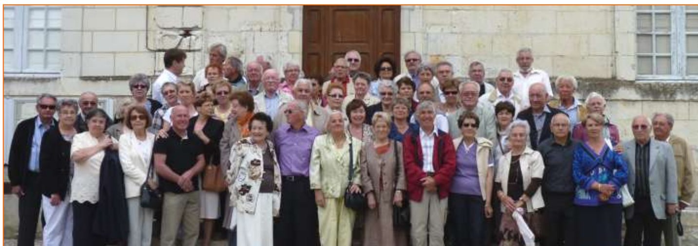
22 mai, réunion des "Petits Drôles" de Beaulieu, les anciens de l'école communale (avant 1960)

Ces nouveaux hébergements s'ajoutent aux existants, l'hôtel de Beaulieu (tel 02 47 91 60 80 www.hotel-restaurant.hoteldebeaulieu.fr ) et les chambres d'hôtes du moulin de l'Aumônier (tel 02 47 91 63 38 www.moulin-aumonier.com )