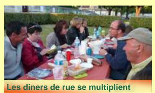
Les diners de rue se multiplient