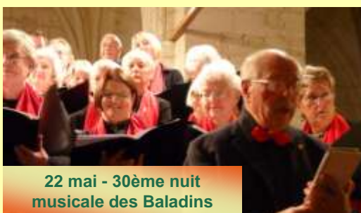
22 mai - 30ème nuit musicale des Baladins