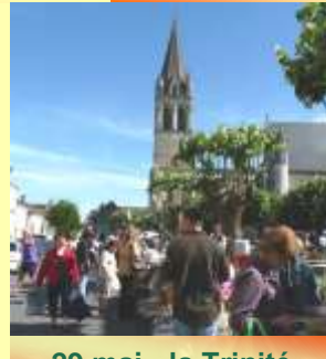
29 mai - la Trinité