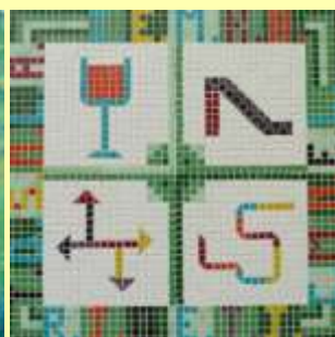
27 mai - 14 juin : les carrés d'art

À gauche IME les Althéas, à droite école élémentaire