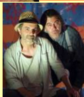
21 mai - "Dialogue avec mon jardinier" par la C ie l'Echappée Belle

À gauche IME les Althéas, à droite école élémentaire