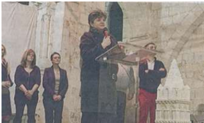
26 janvier 2018 : les vœux du Maire