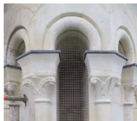
Sculpture des chapiteaux par le sculpteur Xavier Narbonne