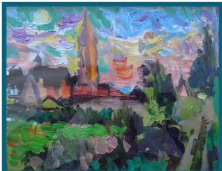
L'abbatiale vue depuis les Petits jardins. Aquarelle Daniel Fisher.