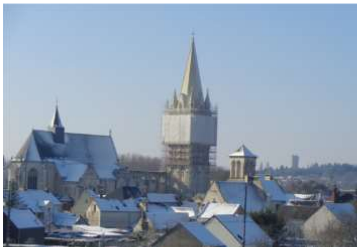
Février 2018 : le Grand Clocher sous la neige.