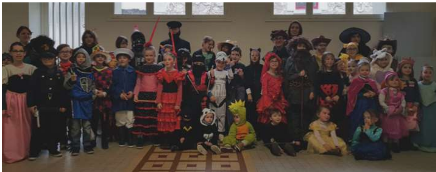
17 février : Carnaval organisé par l'association des Parents d'élèves APEBF.