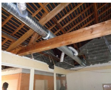
Plafond avant pose de la membrane pare-vapeur

Les travaux devaient normalement s'achever avant la rentrée des classes, mais ne sont pas terminés. En effet, la faillite d'une entreprise a entraîné des dysfonctionnements qui ont impacté le planning prévu.