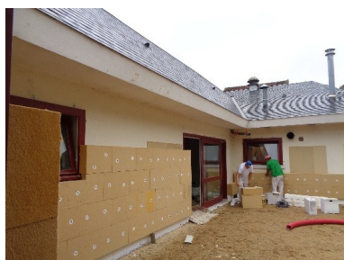
Isolation par l'extérieur d'un patio

Le montant des travaux est de 425 000 €. La Commune a bénéficié pour les financer du soutien de l'Etat (178 000 €), de la Région Centre Val de Loire (107 000 €) et de 5 000 € de Certificats d'Economie d'Energie. Le reste à charge de la Commune, après remboursement de la TVA, sera de 71 000 €. Les économies réalisées en consommation énergétique (6 300 € d'économies estimées par an, sur la base du coût actuel de l'énergie) compensent dès maintenant l'effort financier consenti par la Commune.