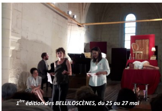
1 ère édition des BELLILOSCÈNES, du 25 au 27 mai