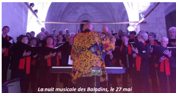
La nuit musicale des Baladins, le 27 mai