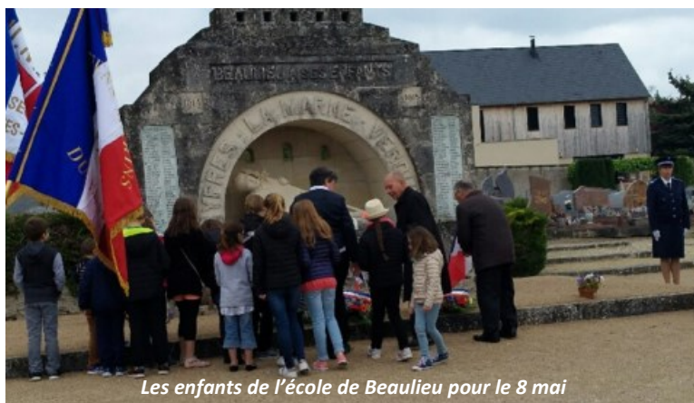
Les enfants de l'école de Beaulieu pour le 8 mai