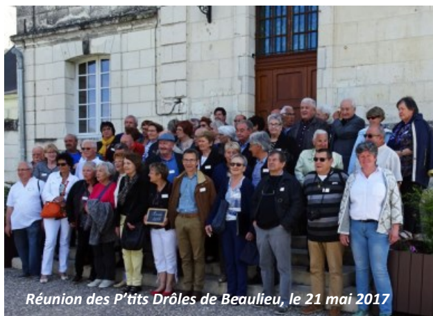
Réunion des P'tits Drôles de Beaulieu, le 21 mai 2017