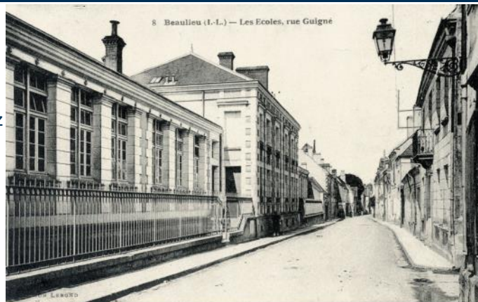
Carte postale "Collection Frédy Richard"