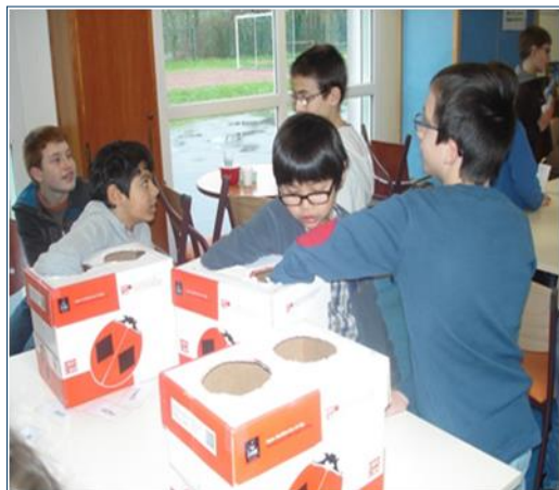
Un atelier à l'ime sur l'éveil des sens. "Le toucher";

Cette action de coopération permettra aux enfants et professionnels d'apprendre à se connaître, de créer des liens à travers un projet commun, l'objectif étant pour quelques enfants de l'Ime d'être accueillis à l'école élémentaire à la rentrée 2014, dans le cadre d'une classe externalisée.