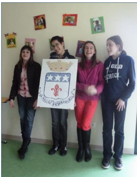
Une création de l'Ime les Althéas pour la mairie