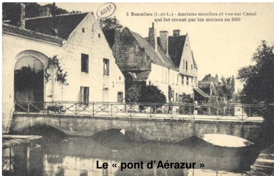
Le « pont d'Aérazur »

Le CIAS, le Secours Catholique, le Secours Populaire et l'association Saint-Vincent-de-Paul récupèrent le mobilier qui vous encombre, il peut être très utile à nombre de personnes. Contactez le 06.33.01.82.55