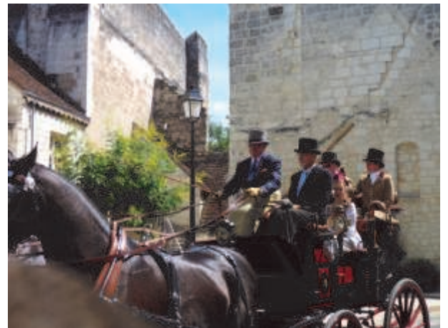
21 & 22 juillet 2 ème CONCOURS D'ATTELAGE DE TRADITION