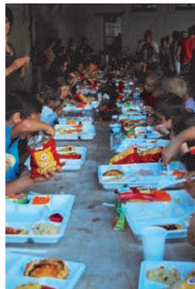
Fête de l'école élémentaire