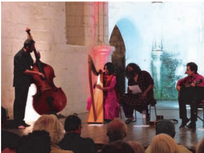
Aout : concert Hamara India au profit de la Latika Roy Foundation