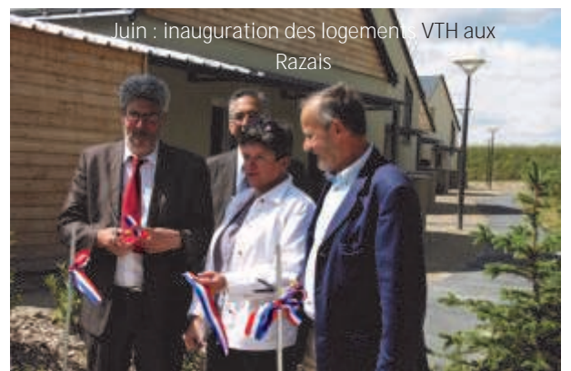
Juin : inauguration des logements VTH aux Razais