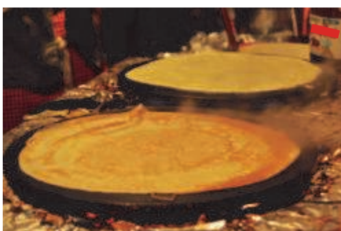
Les crêpes des Amis de Saint-Laurent