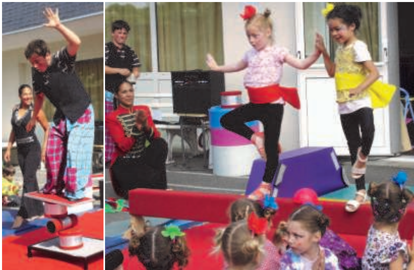
Juin : les enfants font le cirque à l'école maternelle !