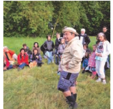
Festival Excentrique 2012