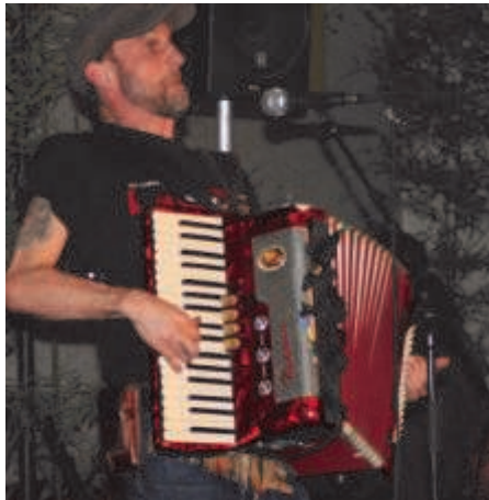
GUINGUETTE - 28 avril