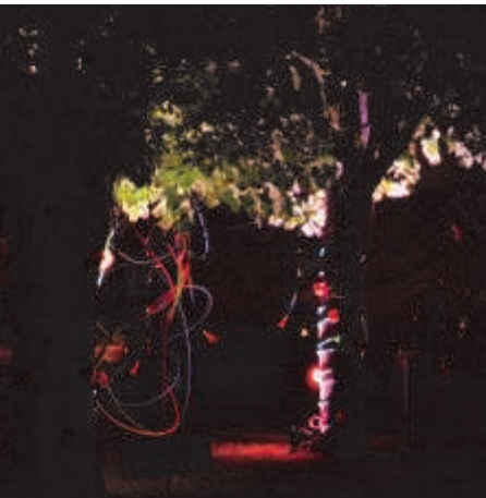
Festival Excentrique 2012