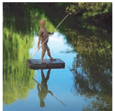
Festival Excentrique 2012