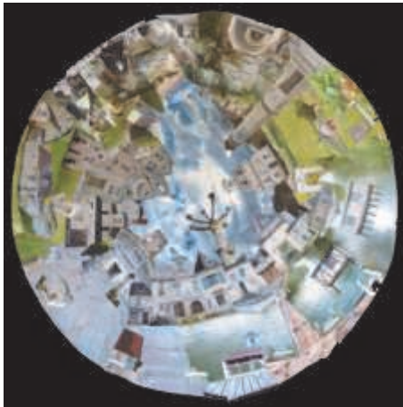
Carrés d'art 2012