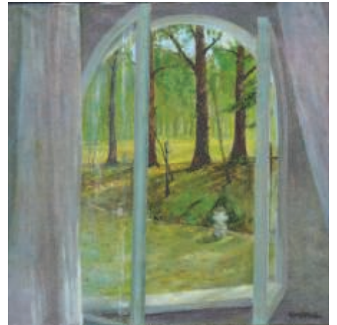
Carrés d'art 2012