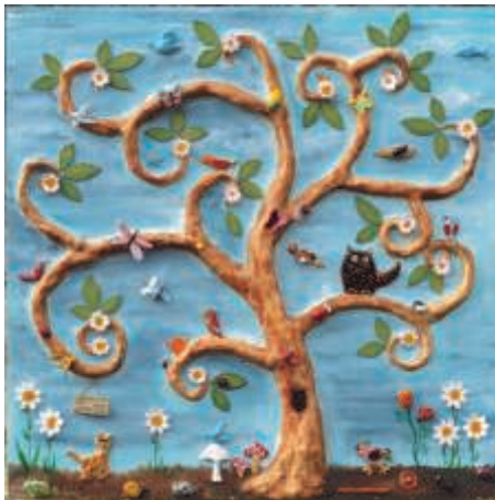
Carrés d'art 2012