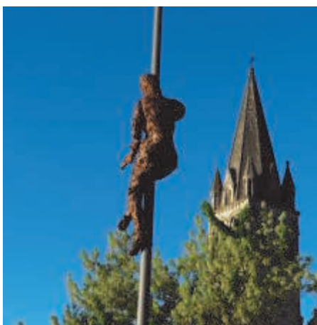
Festival Excentrique 2012