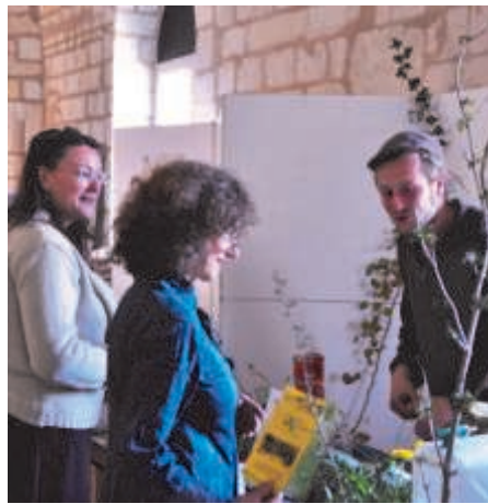
ECOSPHERE - FAMILLES RURALES