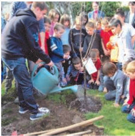
Plantation de l'arbre de la laïcité le 22 mars