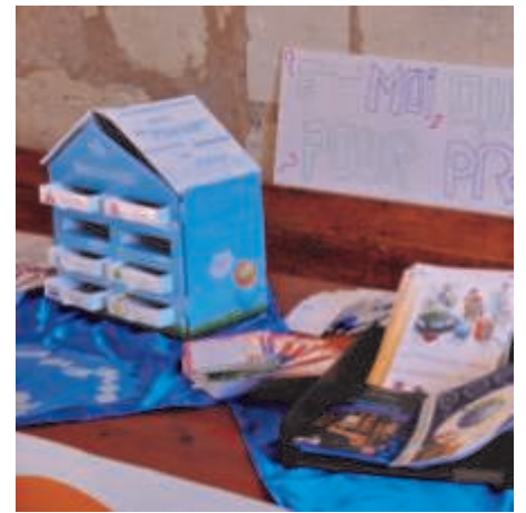
ECOSPHERE - FAMILLES RURALES