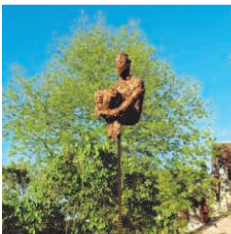
Festival Excentrique 2012