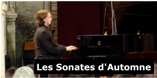
Les Sonates d'Automne