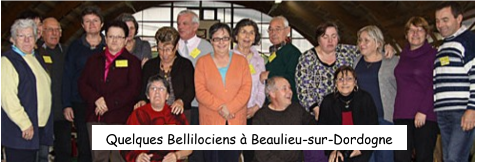
Quelques Bellilociens à Beaulieu-sur-Dordogne

Au programme, visites touristiques et découverte de la région, retrouvailles entre amis, dégustation des produits locaux et repas partagés dans la joie et la bonne humeur ; pour les élus et les membres de l'association, une réunion d'échanges et la tenue de l'Assemblée Générale (photos sur http://www.beaulieu-de-france.com/ ). 24 Bellilociens étaient du voyage, prêts à prendre des notes en vue de l'organisation de la prochaine rencontre dans NOTRE Beaulieu les 10 et 11 septembre prochains.