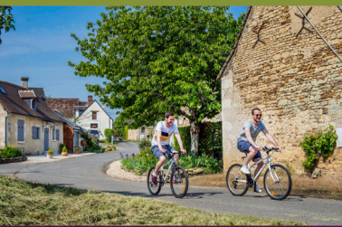
Les Gaillards à Bossay-sur-Claise