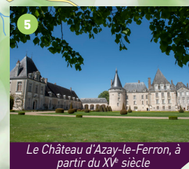
Le Château d'Azay-le-Ferron, à partir du XV e siècle