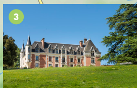
Château de Rys à Bossay-sur-Claise, à partir du XV e siècle