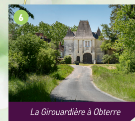
La Girouardière à Obterre