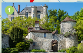
Château du Lion (1905) et Musée de la Poterne (XV e siècle) à Preuilly-sur-Claise