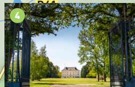
Château de la Boussée, XIX e siècle