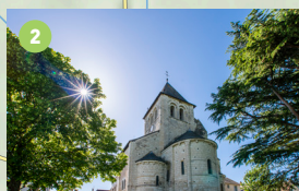
Église Saint-Martin (XII e siècle) à Bossay-sur-Claise