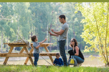
Étang de la Ribaloche dans la Forêt de Tours-Preuilly