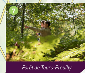
Forêt de Tours-Preuilly