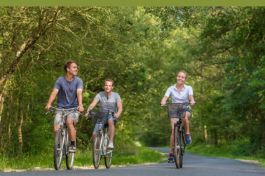
Dans les bois