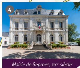
Mairie de Sepmes, XIX e siècle