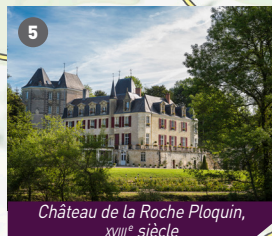
Château de la Roche Ploquin, XVIII e siècle