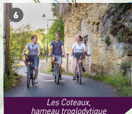
Les Coteaux, hameau troglodytique