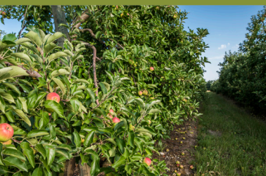
Les Vergers de la Manse