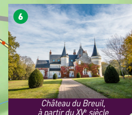
Château du Breuil, à partir du XV e siècle