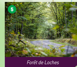
Forêt de Loches