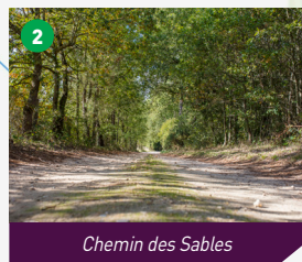
Chemin des Sables