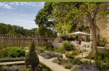
Jardin de curé au Presbytère de Chédigny