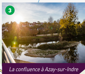
La confluence à Azay-sur-Indre