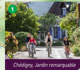
Chédigny, Jardin remarquable