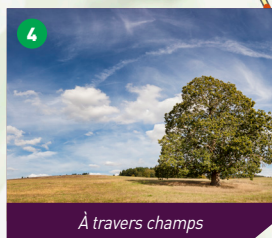
À travers champs